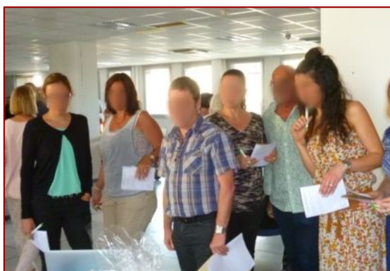
Recyclo Quizz avec lots issus du réemploi, exposition pédagogique, ...

Contactez-nous pour une proposition personnalisée.