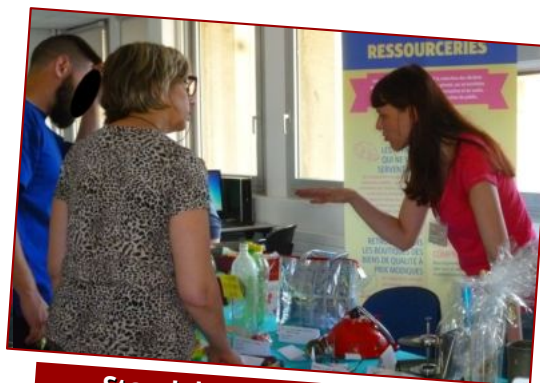
Stand d'animation à la prévention et la réduction des déchets