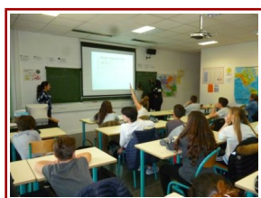
Présentation numérique ludique