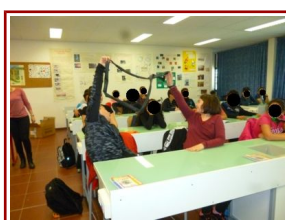
Poubelle au régime