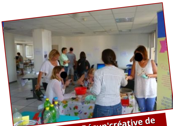
Atelier de Récup'créative de courte durée

Dans le cadre de portes ouvertes, journées Responsabilité Sociétale des Entreprises, séminaires d'entreprise, ... Nos offres précédentes peuvent s'adapter à votre événement !